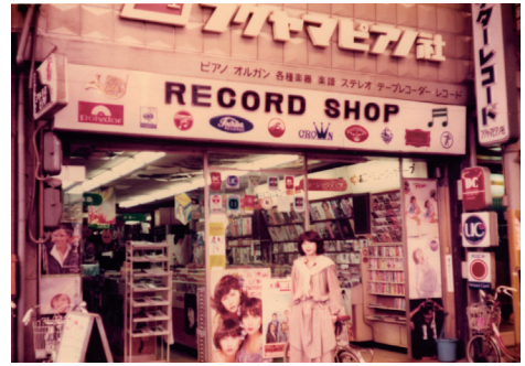
▲1961年に福山市霞町に創業した「フクヤマピアノ社」