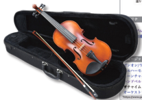
▲楽器専門店と組み品揃えと利便性を高める1998年に開設された楽器のオンラインショップ「gakki.com」

個性派講師陣による楽しく上達するレッスンが特徴の音楽教室(集団のハーモニカレッスン、個人のピアノレッスン)