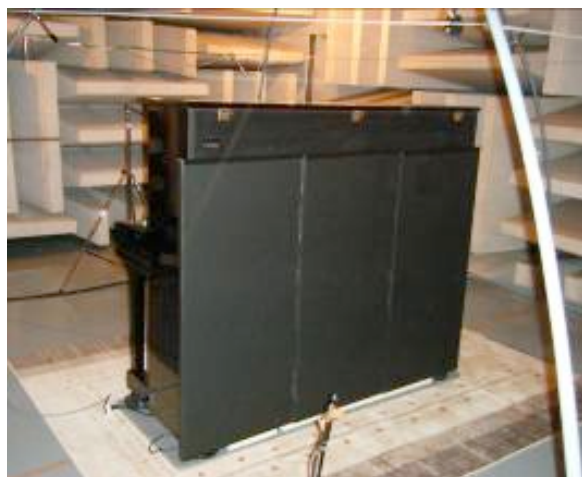
東京都立産業技術研究センターの半無響室にて測定風景